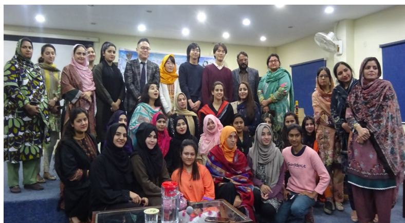
ラーホール女子大学