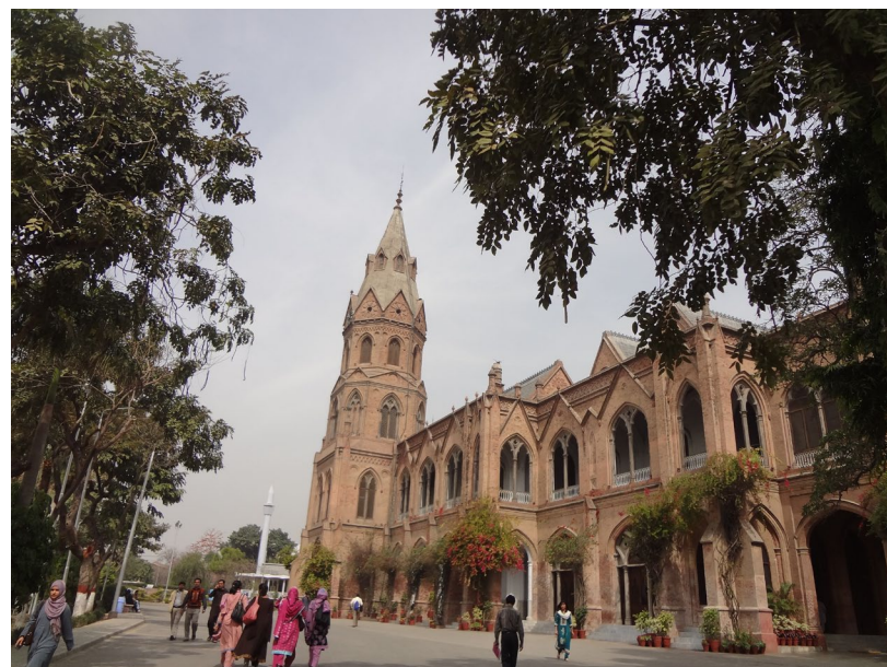
ガヴァメント・カレッジ大学