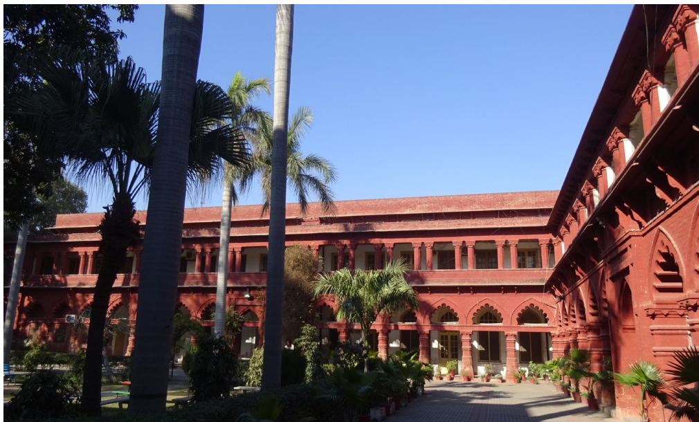
パンジャブ大学オールドキャンパス